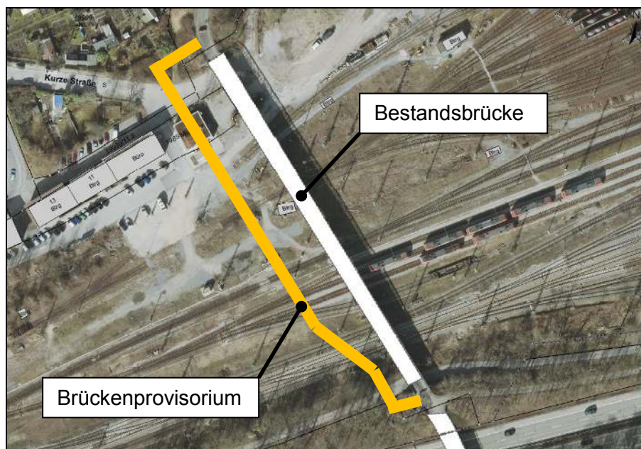
Abb. 1: Lage eines Brückenprovisoriums westlich der Bestandsbrücke

Eine Folgenutzung dieser Behelfskonstruktion ist nur sehr eingeschränkt möglich: Es könnten die einzelnen Überbausegmente zwar im Zuge anderer Baumaßnahmen wiederum als Behelfskonstruktion theoretisch zum Einsatz kommen, wenn die zu überbrückende Spannweite im konkreten Fall ähnlich einem dieser Überbausegmente ist. Allerdings müssten die Überbausegmente dazu dauerhaft zwischengelagert werden. Selbst bei Vorliegen eines geeigneten Zwischenlagers ist zu bedenken, dass ein ständiger Bedarf an einer Behelfskonstruktion, sprich regelmäßig eine Brückenbaumaßnahme mit der Erfordernis eines Provisoriums und passenden Abmessungen, nicht besteht. Die Folgenutzung wäre also allenfalls auf Einzelfälle und auch nur Teile der Gesamtkonstruktion begrenzt und somit nicht im Verhältnis zum vorgenannten Aufwand.